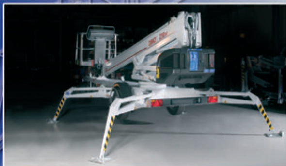
Erikoisrakenteiset niveltukijalat – suuri maavara.