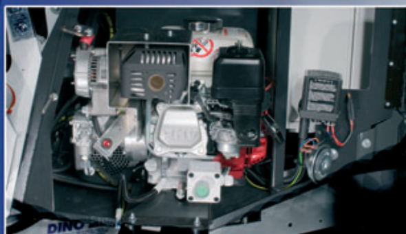
Bensiiniaggregaatti vakiona – käyttövoimaa nostimelle myös ilman verkkovirtaa.