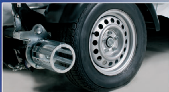
Ajolaite vakiona – käyttö yksinkertaista.